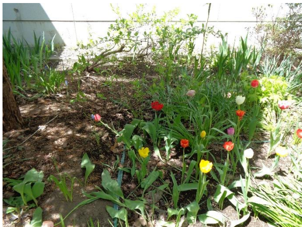
色とりどりのチューリップ🌷

たくさんの種類の植物が植えられています。撮影時に咲いていたお花もいくつかありました。