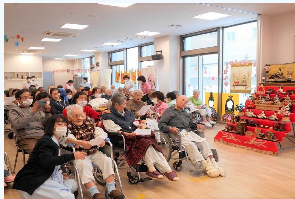
ひな人形のお飾りとお琴の演奏会