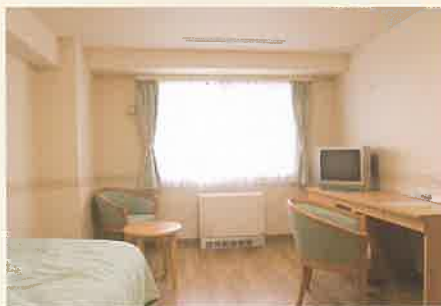
1ルーム Aタイプ(ゲストルーム)