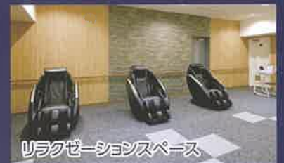
リラクゼーションスペース